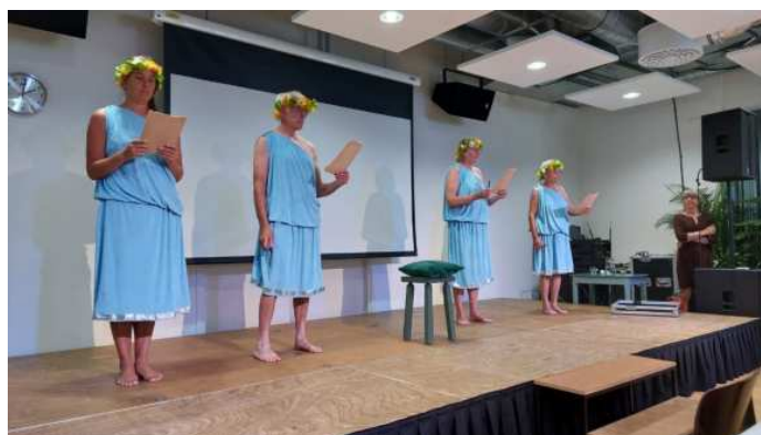
Openingsceremonie door de "Vier van vuur".