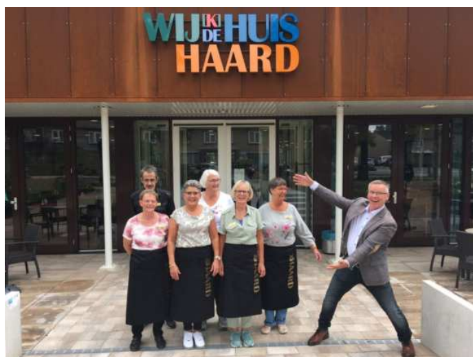
De gastvrouwen en -heren