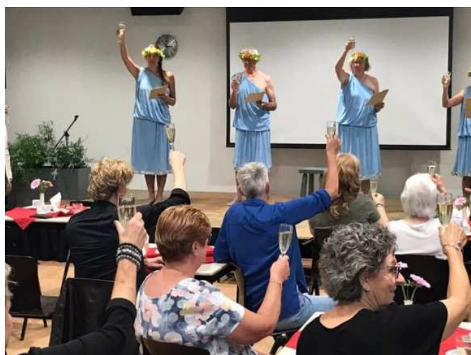
Toost op het nieuwe wijkhuis.