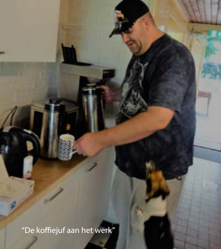
“De koffiejuif aan het werk”