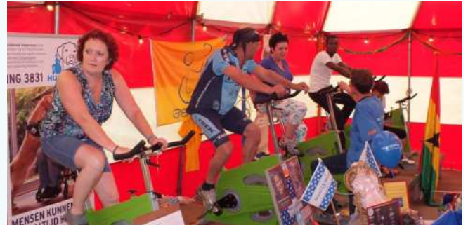
Fietsen voor het goede doel