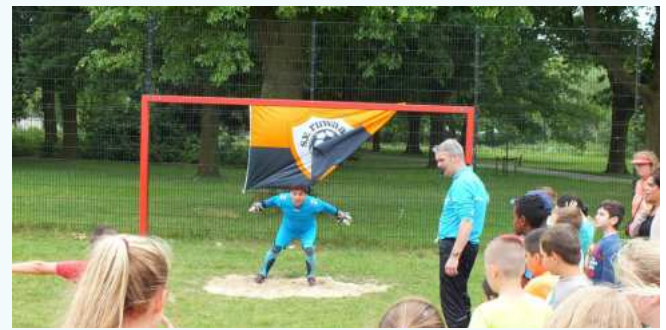
Doelschieten met SV Ruwaard