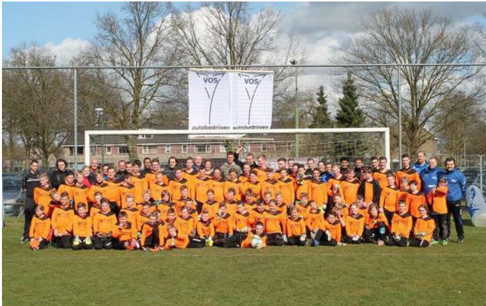
Regionale Jeugdkeepersdag SV Ruwaard (27 maart) wederom geslaagd!