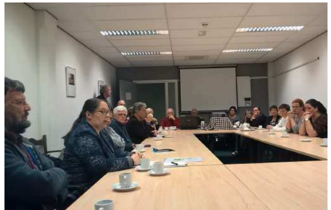
Informatie avond WhatsApp-groep