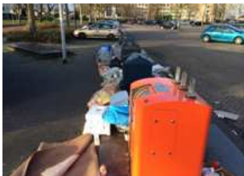
Foto: Locatie parkeerplaats Albert Heijn

Laten we elkaar aanspreken op het dumpen van afval in de openbare ruimte. Want wennen doet dat nooit.