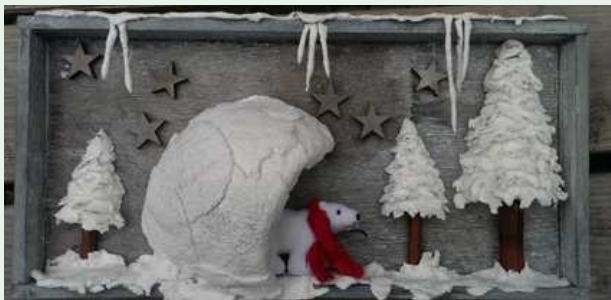
Winterlandschapje van klei