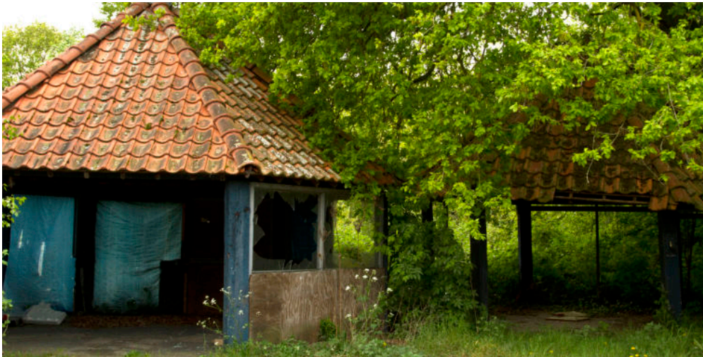
Archief foto: Tuincentrum Zwanenberg door Helene Smits