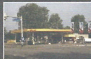
Shell Hanex Hescheweg, Oss

Kijk voor meer informatie ook op www.hanex.nl