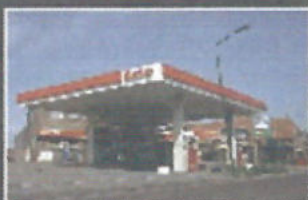
Esso Hanex Berghem