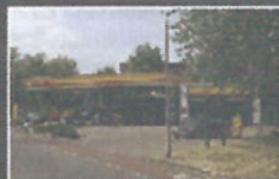
Shell Hanex De Ruwaard, Oss