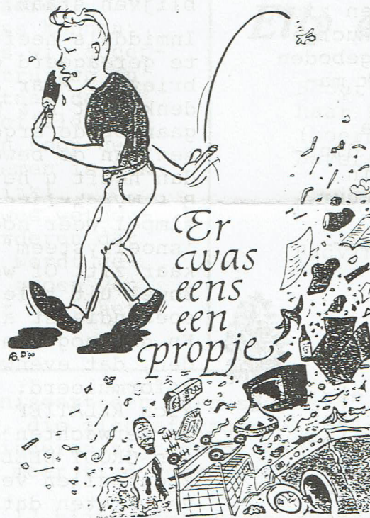
DOE IETS !

Evenals vorig jaar gaan een groot aantal buurten de woonomgeving schoonmaken.