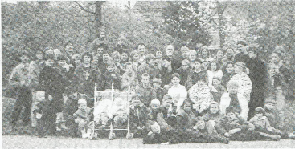
De schoonmaakploeg van de Sibeliuslaan, zoals die in de loop der jaren gegroeid is van een klein aantal tot dit in 1990.